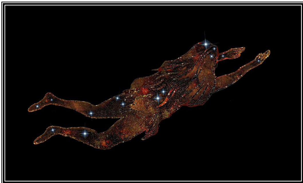
(Der große Schöpfungsmensch ist der verlorene Sohn Luzifer)

Daher hat die gesamte materielle Schöpfung die Gestalt eines Menschen, die im unendlichen Ätherraum schwebt.