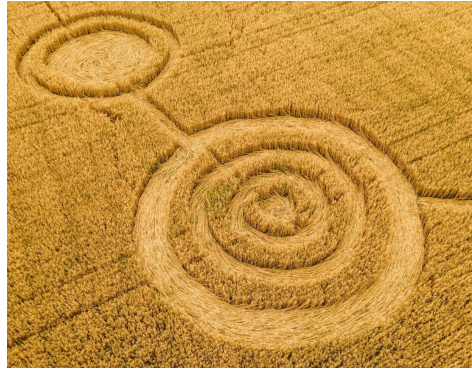
(Typisches Bild eines von Menschen gemachten Kornkreises)

Ähnliches geschieht auch bei der Erscheinung von Kornkreisen ! Natürlich gibt es auch hier wieder Menschen, die solche Kornkreise fertigen, aber das sind dann sehr primitive Formen, und können sehr leicht als Fälschungen entlarvt werden. Bei den komplizierten, mathematisch exakten Kornkreisen, die innerhalb weniger Stunden entstanden sind, wurden aber fast immer irgendwelche Lichterscheinungen beobachtet