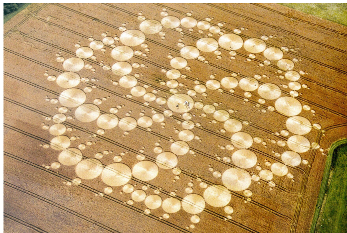
(Solche mathematisch exakte Kornkreise bringt kein Mensch über Nacht zustande)

Es gibt eben noch viele Dinge zwischen Himmel und Erde, die durch reines menschliches Wissenschaftsdenken nicht erklärt werden können.