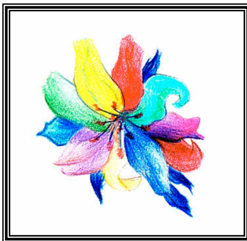
Spiegelbaumbüte mit 10 verschieden farbigen Blütenblättern.

Diese Frucht besteht im Anfang in nichts anderem als in einem sehr durchsichtigen Wasserbeutel, der nach und nach immer größer und größer wird und in seiner Reife einem Ballon gleicht. Wenn diese Frucht zu dieser ersten Reife gelangt ist, fängt die Flüssigkeit in diesem Beutel sich so zu verdichten an, daß der Beutel zusammenschrumpft und nach und nach von der verdichteten Flüssigkeit sich losschält. Die verdichtete Flüssigkeit fällt dann oft samt dem Stiel auf den Boden herab. Alsdann kommen die Bewohner und sammeln diesen harten Saft auf, beschneiden denselben auf allen Seiten regelmäßig, bilden daraus eigenartige, regelmäßige viereckige Tafeln und gebrauchen diese ungefähr so wie wir auf der Erde unsere Spiegel.